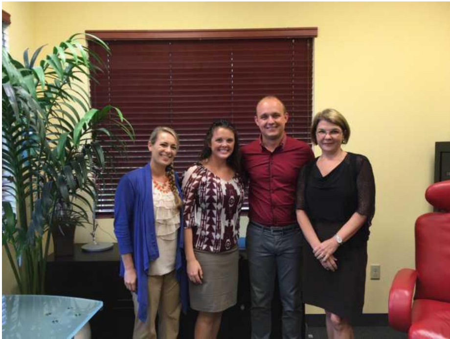
Sa delom tima Child Neurology Center of Orlando